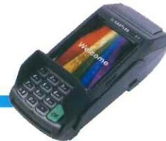
クレジット決済端末